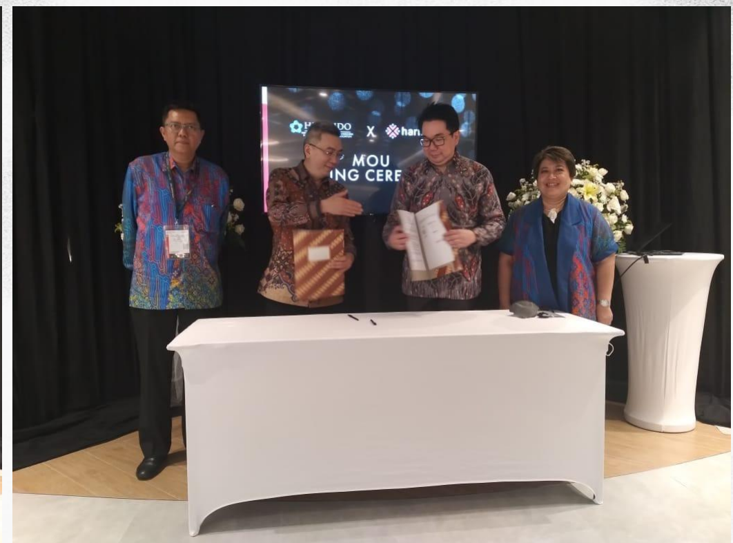
Program Loyalitas Pelanggan (HARMONIX) - 15 Agustus 2022