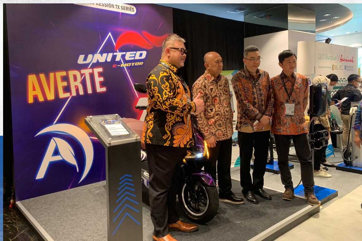
Green Retail - 15 Agustus 2022