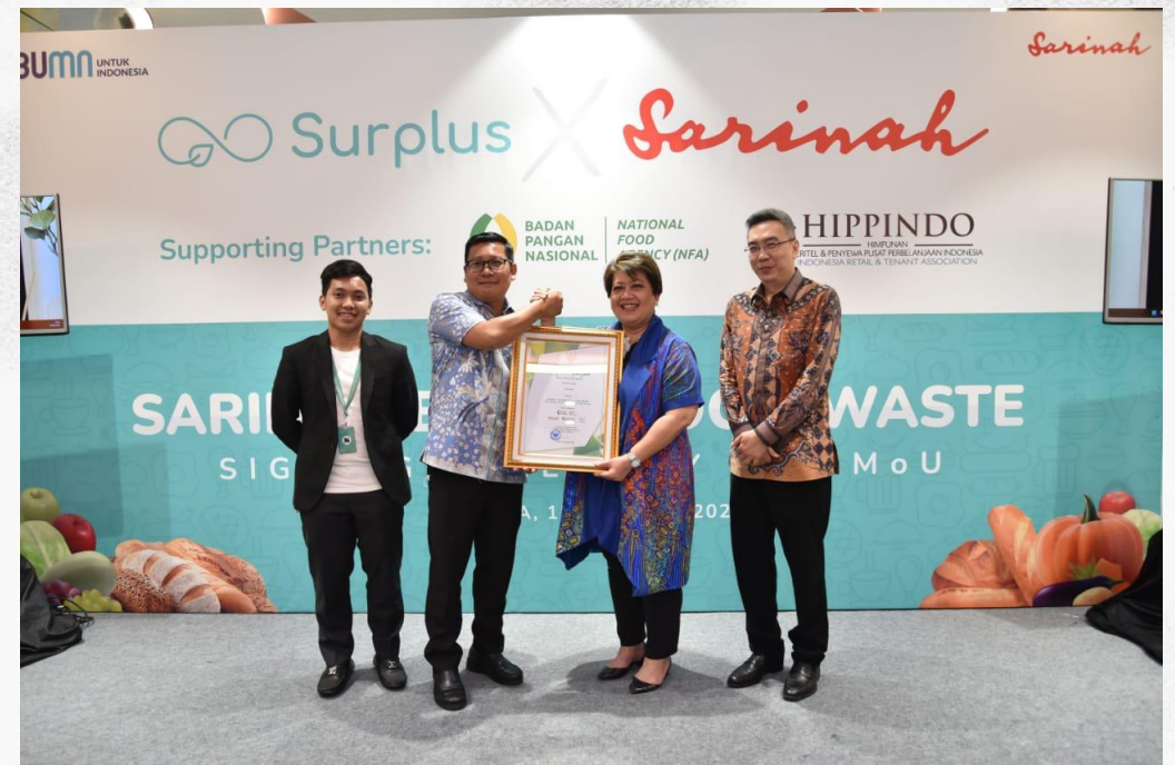
Sarinah Bebas Food Waste dengan Badan Pangan Nasional - 15 Agustus 2022