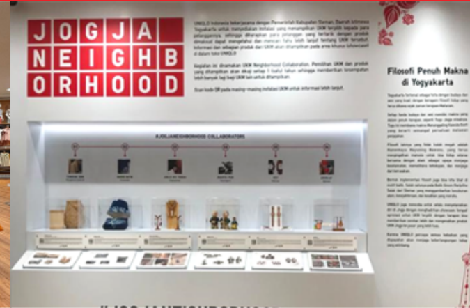
UNIQLO Neighborhood Collaboration – Jogjakarta